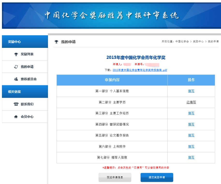
图 8 填写申报内容页面