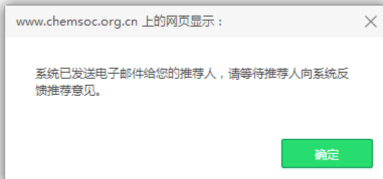
图 17 发信提示页面

当申请人确认提交申报信息后，系统将自动给每位推荐人发送推荐邀请（图 17）。推荐人可根据实际情况同意或拒绝推荐。申请人可以通过“我的申请”查看推荐状态及推荐意见反馈情况（图 18）。