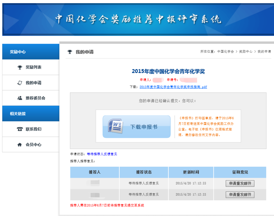
图 9 提交申请成功页面

当提交奖励申请成功后，页面将自动跳转至“我的申请”，点击“下载申报书”，导出申请人的《申报书》DOC 文件（图 9）。导出后的申报书只可修改格式，内容需与电子版保持一致。