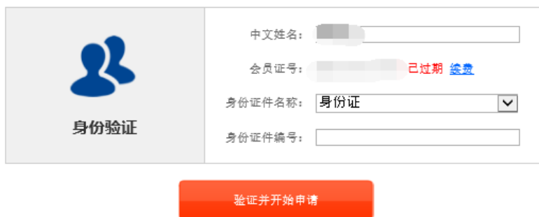
图 4 个人会员过期提示