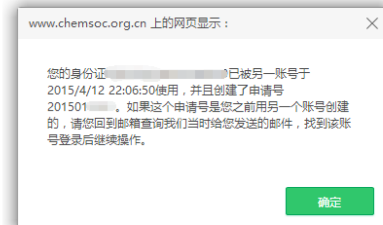
图 7 重复申报奖励提示页面

提示： 非中国化学会会员需先办理入会手续，成为个人会员后，再申报学会奖励。忘记会员证号的申请人可登陆个人会员中心，查看会员证号。如果忘记登录密码，可通过注册时的 Email 和姓名重置密码。