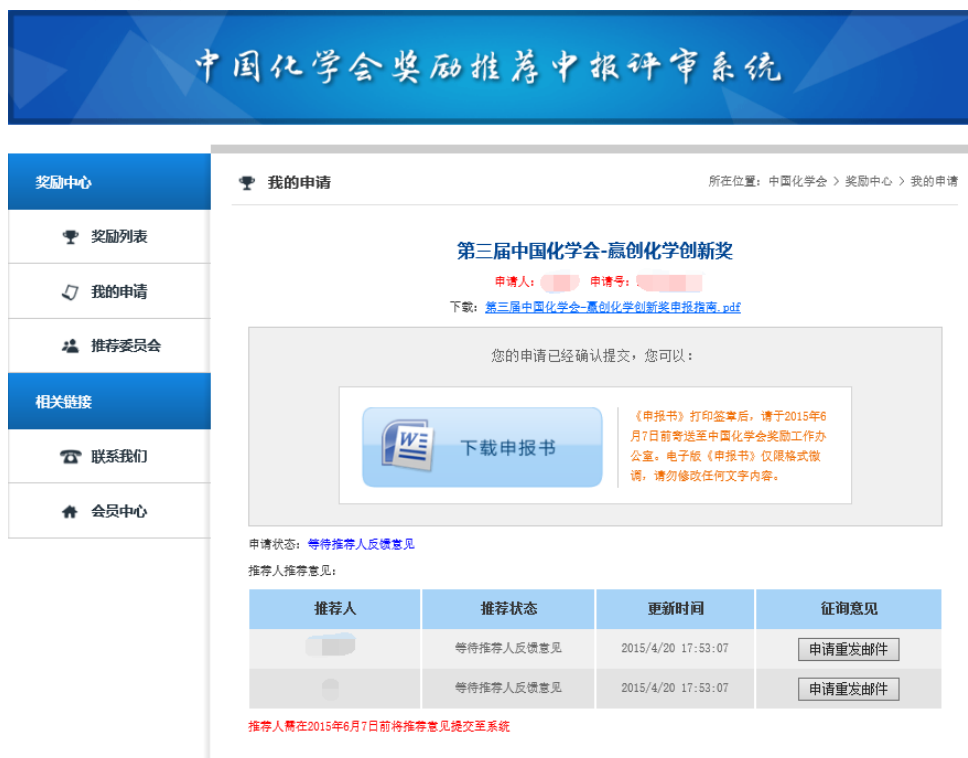
图 9 提交申请成功页面

当提交奖励申请成功后，页面将自动跳转至“我的申请”，点击“下载申报书”，导出申请人的《申报书》DOC 文件（图 9）。导出后的申报书只可修改格式，内容需与电子版保持一致。