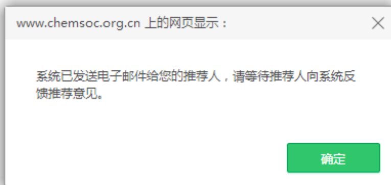
图 18 发信提示页面

当申请人确认提交申报信息后, 系统将自动给每位推荐人发送推荐邀请。推荐人可根据实际情况同意或拒绝推荐。申请人可以通过“我的申请”查看推荐状态及推荐意见反馈情况(图 18)。