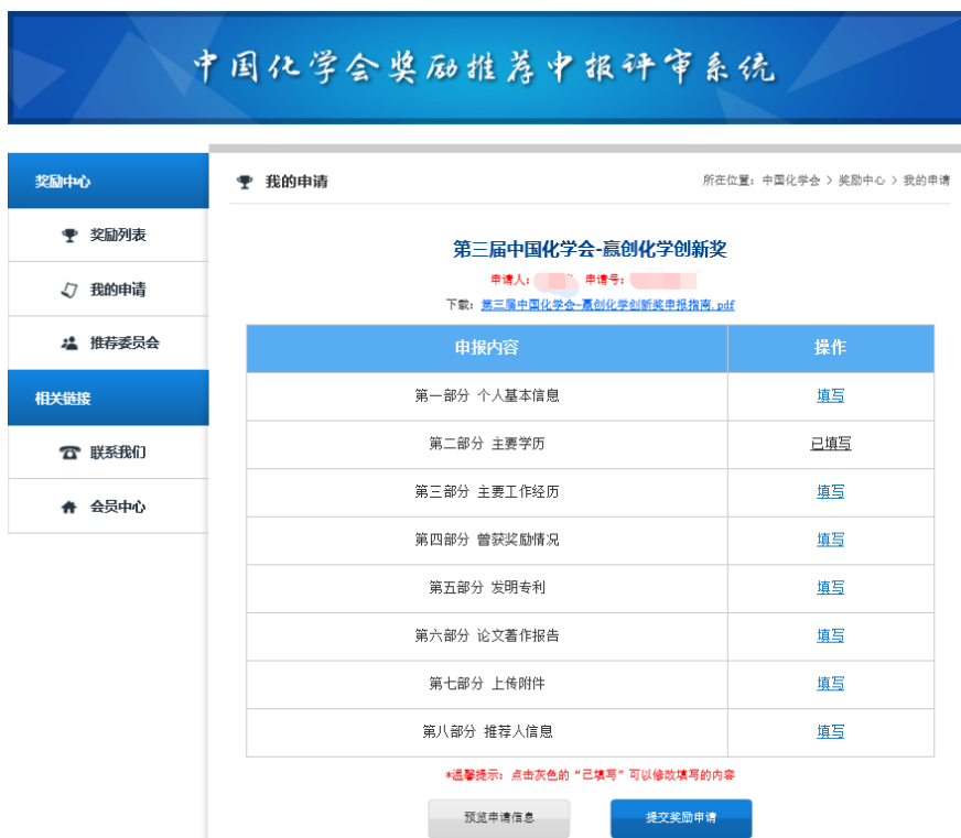
图 8 填写申报内容页面