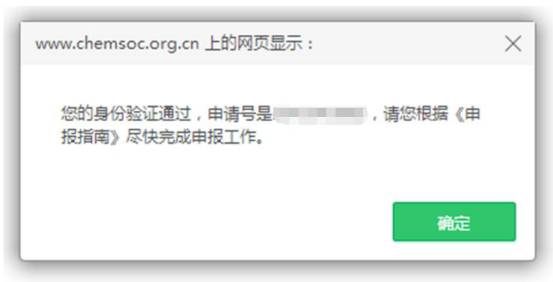
图 3 身份验证成功并获得申请号

如果点击“验证并开始申请”后, 页面显示“已过期续费” (图 4), 表示申请人的会员身份已经过期。可先缴纳会员费, 成为有效个人会员后, 再次申报。