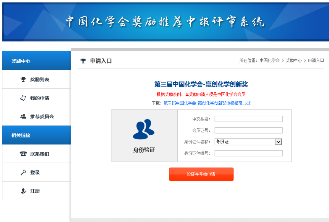
图 2 身份验证页面